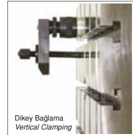
Dikey Bağlama Vertical Clamping